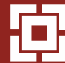
РУБИКОН межсетевой экран и система обнаружения вторжений