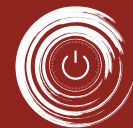
МДЗ-Эшелон модуль доверенной загрузки