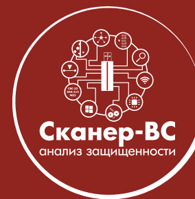
Сканер-ВС анализ защищенности